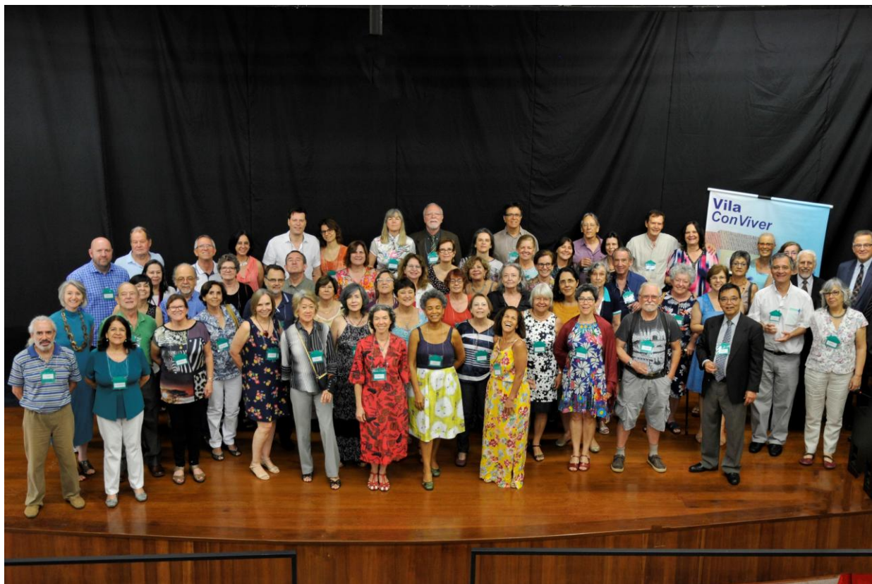
Foto dos futuros moradores da Vila ConViver na Assembleia de Fundação da Associação